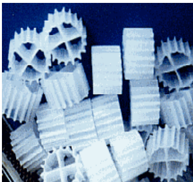
미생물 부착전 생물막 담체

- 담체를 선정하는데 가장 중요한 요소중 하나는 경제성과 제조의 용이함이다. MBBR 담체는 길이 방향으로 분리벽을 갖는 인발 성형되는 튜브조각이다. 이런 담체가 특별히 좋은 이유는 다른 가능한 방법(예를 들어 각각의 담체가 개별적으로 제작되어야 하는 주조(die-casting)) 보다 만들기가 쉬워 경제적이기 때문이다. 인발 성형을 위해서 튜브는 연속적으로 인발되면서 적당한 조각으로 잘린다. 모든 분리벽은 튜브의 길이 방향이며 튜브가 잘리는 곳에 관계없이 단면은 항상 같다.