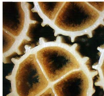
미생물 부착후 생물막 담체